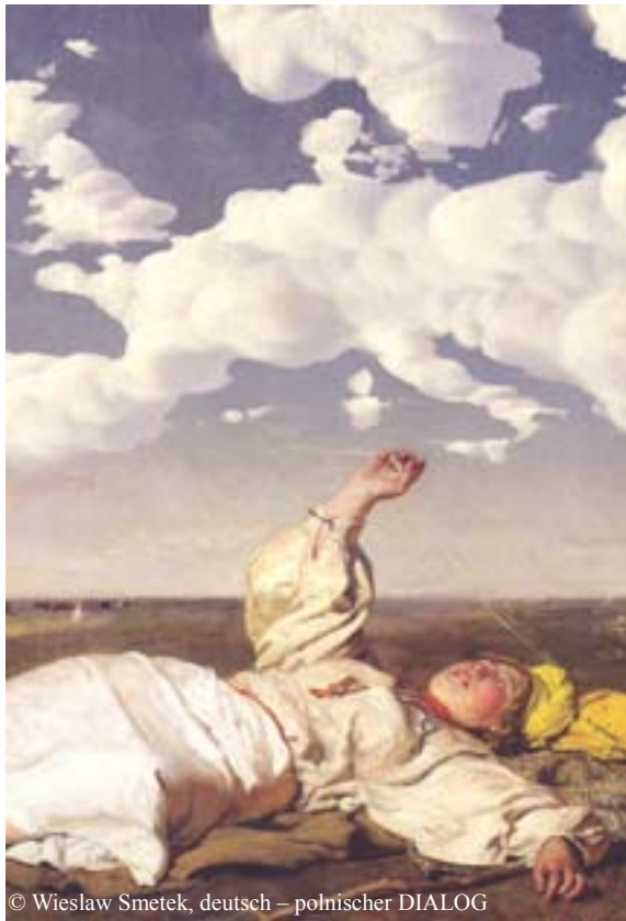
© Wiesław Smetek, deutsch – polnischer DIALOG